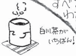
白川茶が いちばん!

さて、今回緑茶(荒茶)の都道府県生産量ランキングをごく簡単に紹介しました。スーパーの都合ですべては紹介できませんが、ランキングを見ていると意外な県でもお茶が生産されていることがわかり大変興味深いものだと感じました。この資料は農林水産省のホームページから統計情報という形で、他の様々な農産物のデータと共に公開されています。ご興味のある方はご覧になってみてはいかがでしょうか? 農水省HPはこちら → http://www.maff.go.jp/