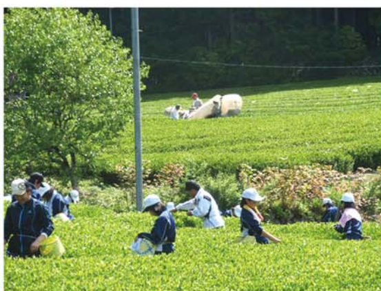
一芯二葉で一葉一葉 ていねいに摘みとりましょ! -地元 中学生-