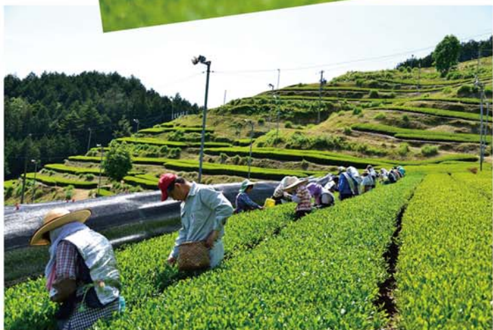
5/24 高望のトビ子摘み - スタッフと地元の皆さん -