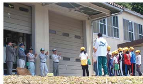
見学に訪れお世話になった 地域の方に歌のプレゼント! -地元 小学3年生-

お茶摘みを通じ地元の産業を知り、地域の人たちとふれあうことにより何かを学んでくれたのではないかと思います。